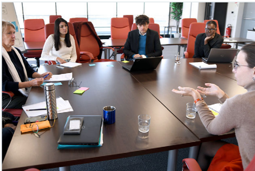
Le plan d'action du CIG inclut une réflexion sur les possibles évolutions réglementaires pour rendre les conseils de discipline plus opérants : un atelier de réflexion associant les agents du secrétariat des instances et les magistrats qui président les séances a eu lieu le 17 octobre à ce sujet.

Le parcours d'accompagnement proposé par ailleurs aux membres des instances (cf. Collectivités n° 77 – octobre 2023) accorde une part importante aux aspects liés à la discipline : parmi les 4 modules proposés, 3 portent sur la procédure disciplinaire, sur les fautes et