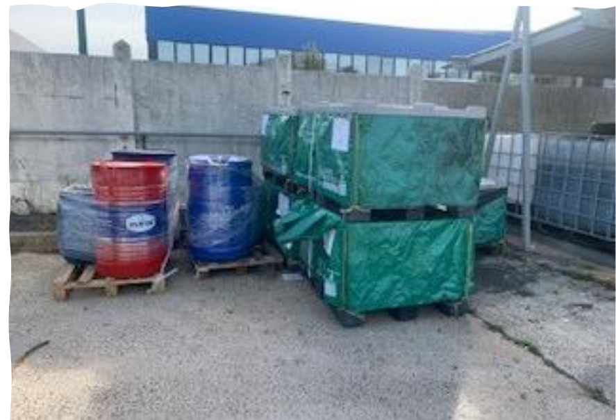
Exemple d'expédition en attente