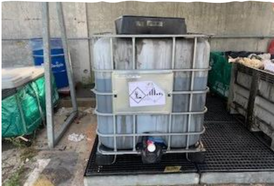
Huile de vidange ( huile industrielle noire)