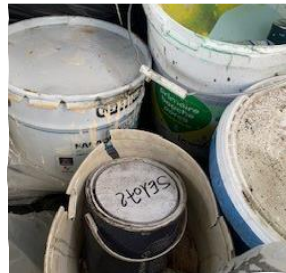
Pâteux non chlorés (Peinture, plâtre ...)