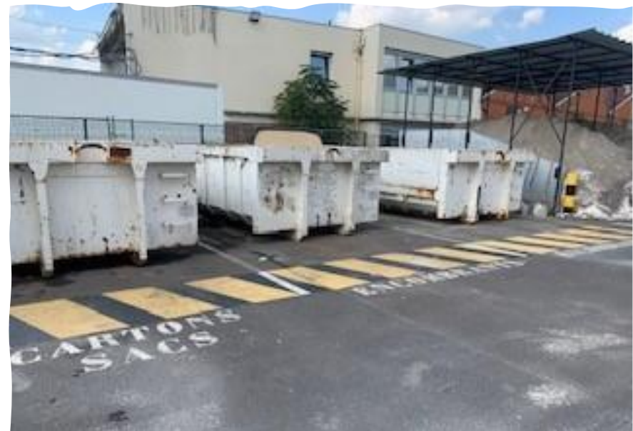
Zones de stockages identifiées marquage au sol