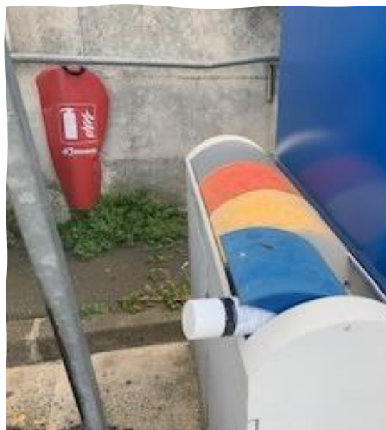
Bac à aérosols