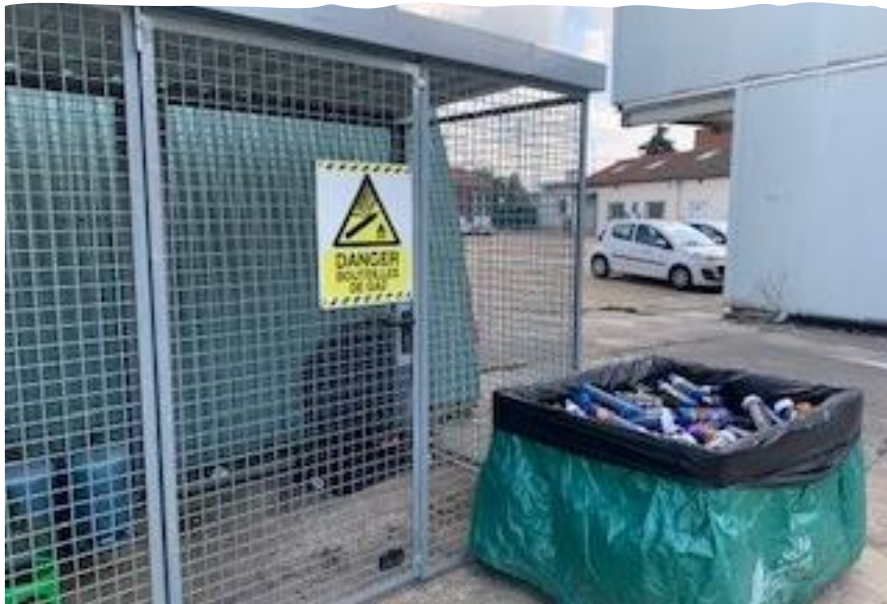
Zone de stockage bouteilles de gaz, extincteurs.. (protoxyde d'azote...)