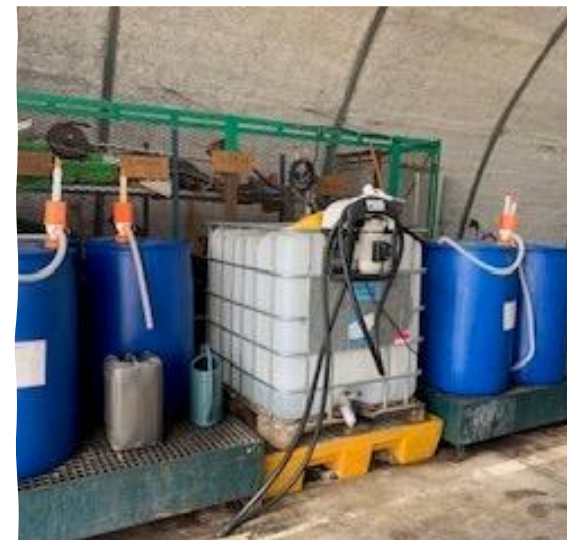
Bacs de rétention Pompes de transvasement