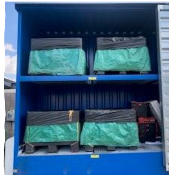
Armoire à déchets