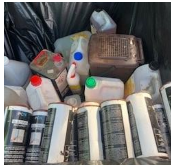
Déchets Dangereux en Quantités Dispersées (DDQD)