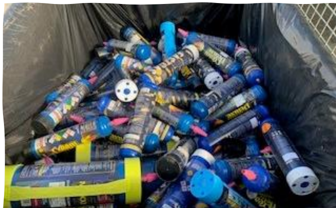
Cartouche de protoxyde d'azote

Les principaux types de déchets récupérés dans la ville